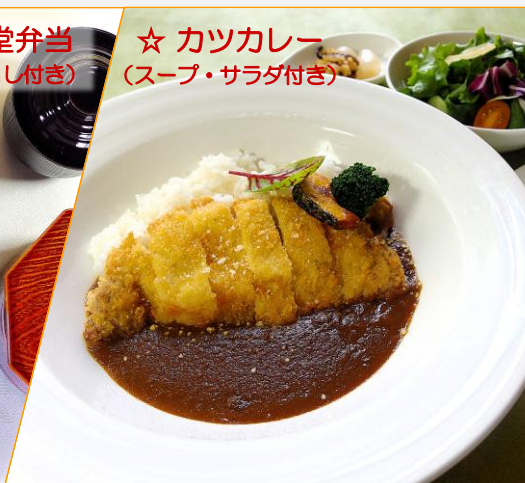
☆ カツカレー (スープ・サラダ付き)