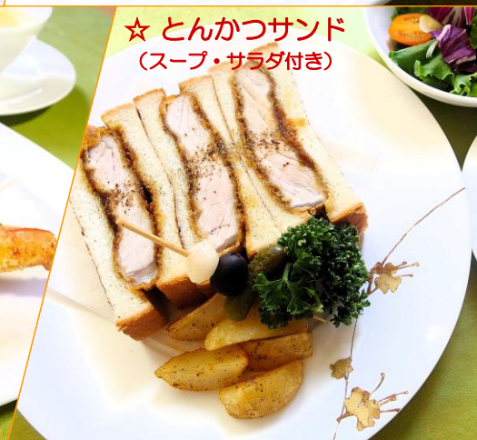
☆ とんかつサンド (スープ・サラダ付き)

※お食事の内容は皆さま同じとなります。 ※松花堂弁当の写真はイメージです。内容は時季によって異なります。 ※緑茶ペットボトルをご選択される場合は事前にお伝えください。 ※2階コスモスは「高速無線LAN (YAMAHA WLX222: Wi-Fi6対応)」を整備しております。 ※ご利用会場については、当館の指定する会場となります。 詳細についてはお問い合わせください。