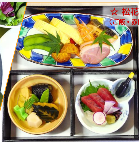
☆ 松花堂弁当 (ご飯・赤出し付き)