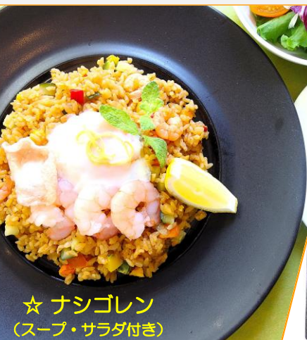
☆ ナシゴレン (スープ・サラダ付き)