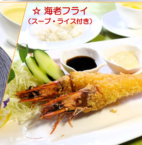
☆ 海老フライ (スープ・ライス付き)