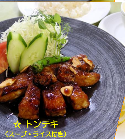
☆ トンテキ (スープ・ライス付き)