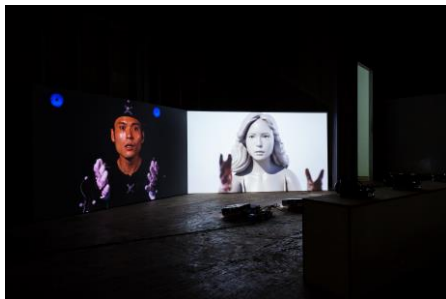
百瀬文《Jokanaan》2019 EFAGEastFactoryArtGalleryでの展示風景 愛知県美術館蔵