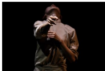
中村蒼中村蒼ソログダンス公演『ジゼル』 2021