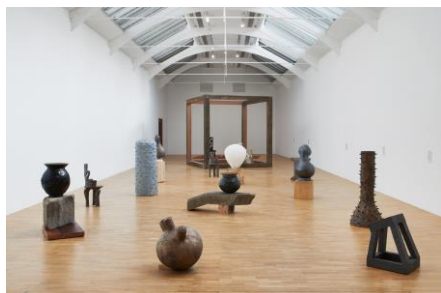
シアスター・ゲイツ 展示風景「A Clay Sermon」ホワイト・チャペルギャラリー (2021・2022、ロンドン、英国)

～国際芸術祭「あいち2022」～STILL ALIVE 今、を生き抜くアートのちから～ 国内最大規模の国際芸術祭の一つ。32の国と地域から、100組のアーティストが参加し、 現代美術、パフォーマンスアーツ、ラーニング・プログラムなど、ジャンルを横断し 最先端の芸術を発信します。