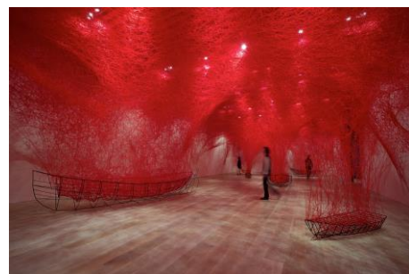
塩田千春《不確かな線》2016/2019、個展「魂がふるえる」 森美術館、東京 Photo:SunhiMang,CourtesyofMori ArtMuseum ©JASPAR,Tokyo,2021 andChiharuShiota