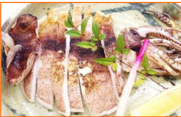
スルメイカー一夜干