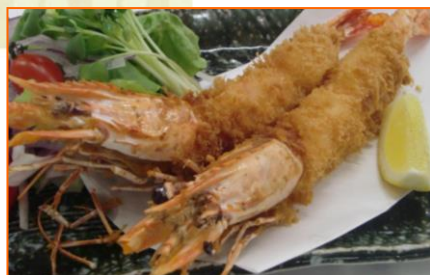
なごや大海老フライ